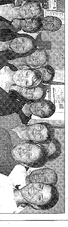
Alle Loks wieder zurück auf die Schienen holen. Dieses Ziel hat sich der Förderverein Steigerwald-Express gesetzt. Momentan basteln die Mitglieder an einer Kleinlok der Bauart Kö. Bis zum 27. April wollen sie diese auf Vordermann gebracht haben.

Kursleiter werden laufend fortgebildet; zudem unterlegt die gesamte Breitenausbildung des Kreisverbandes einem Qualitätsmanagement-System. „Damit können wir eine aktuelle, den jeweiligen Vorgaben entsprechende Ausbildung garantieren“, verspricht Elfriede